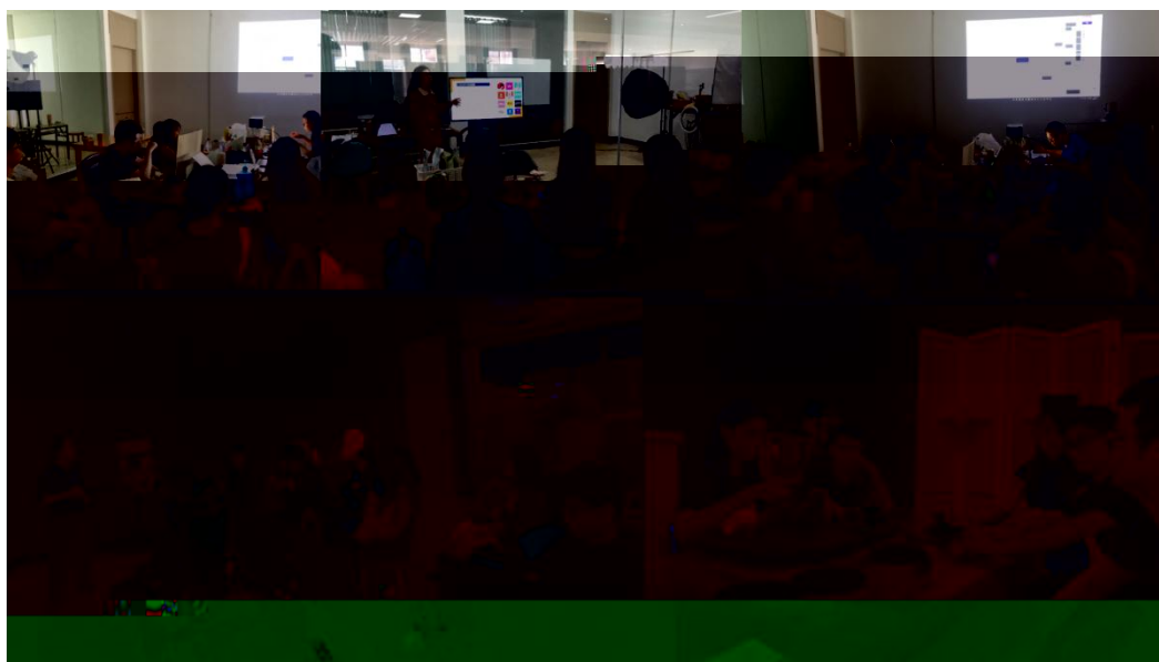
图 特邀企业专家来基地为学生进行专业培训

地 2023 地 ( 2), 供 宝贵的 。 过 的分 , 度 、 场变 , 对电 播 的 。 不 的 储备, 高 操 , 的 发 奠定 础。 措 合 的 度, 地 合 的 。