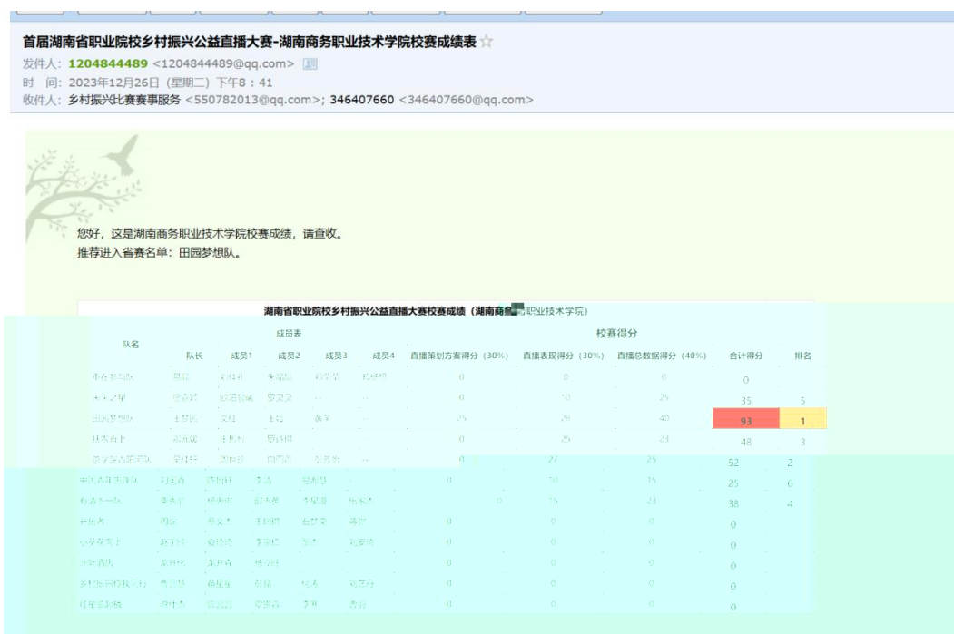
图 湖南商务职业技术学院学生在湖南省首届职业院校乡村振兴直播大赛中获得好成绩

的队。成 的 得不 对 合 方 的 ，更 对公 电 播 导和 操 的 充分 。 过 的 度合 ，公 不 供 的 播 和 ，更 比 搭 才 的 ， 、 供 。